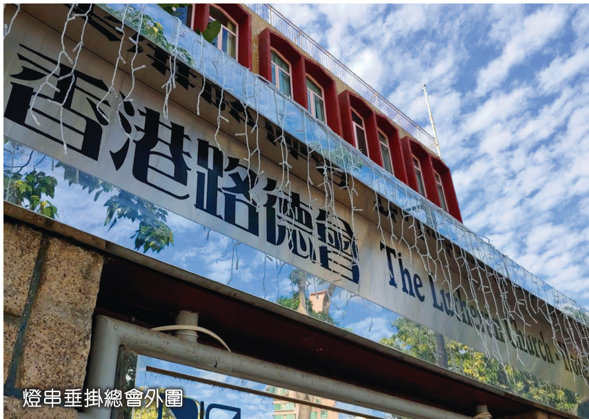
燈串垂掛總會外圍